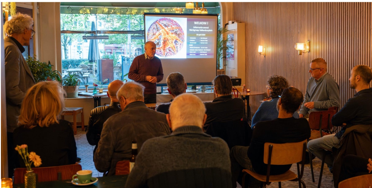
Informatiebijeenkomst voor buurtbewoners, 10 april jl.

De werkgroep vergadert maandelijks, of als noodzakelijk. Het plan is om ook wekelijks bij elkaar te komen en met belangstellende buurtbewoners. De werkgroep heeft meest recentelijk een eerste informatiebijeenkomst gehouden voor de bewoners van het Valkenbosplein en omliggende straten. Voor zo'n 20 belangstellenden waren er verschillende presentaties over de geschiedenis van het plein en over de doelstellingen van de werkgroep.