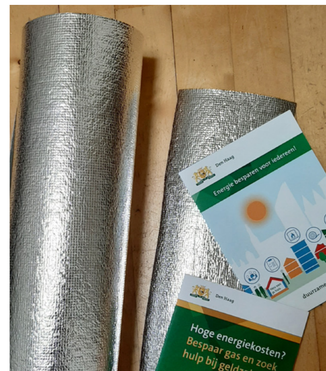
••• Radiatorfolie achter de verwarming houdt warmte binnen